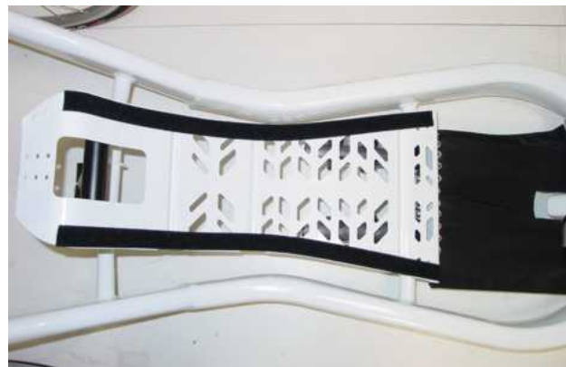
Estructura muy ligera